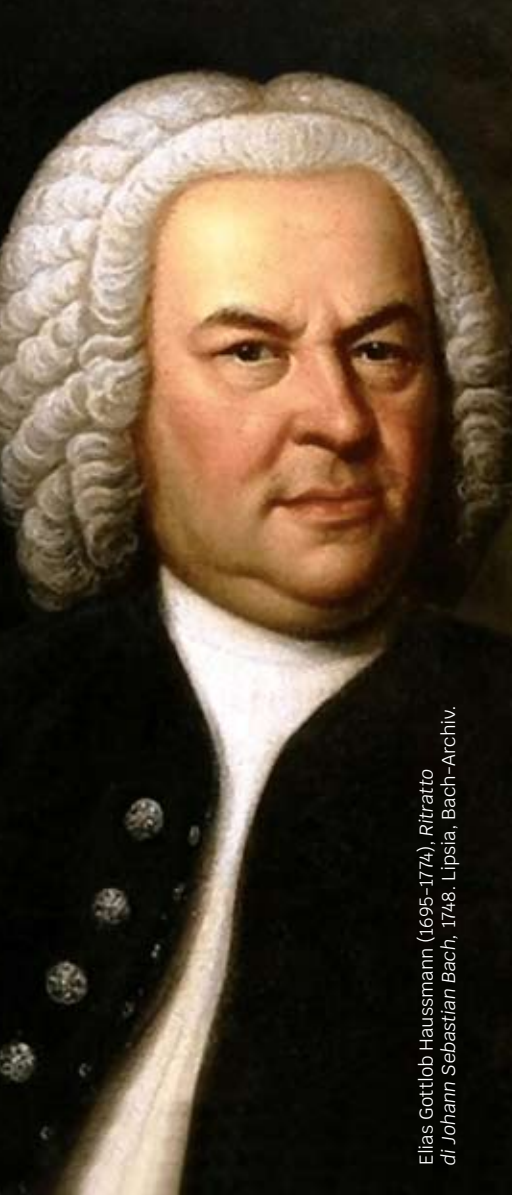
Elias Gottlob Haussmann (1695-1774), Ritratto di Johann Sebastian Bach, 1748. Lipsia, Bach-Archiv.

In questo concerto la trascrizione di Stravinskij sarà incorniciata dalla doppia esecuzione di un'ulteriore versione bachiana del corale, ovvero quella presente nella versione originaria del suo Magnificat , in cui compare un'elaborazione per coro a quattro voci della melodia luterana, poi espunta nella più nota versione definitiva dell'opera. Della melodia del corale si ascolterà dapprima la versione primigenia di Martin Lutero , in semplice veste monodica , poi l' elaborazione polifonica di Bach , infine si entrerà nel "sancta sanctorum", ovvero nel labirinto vertiginoso dei canoni intessuti "a quattro mani" da Bach e Stravinskij.