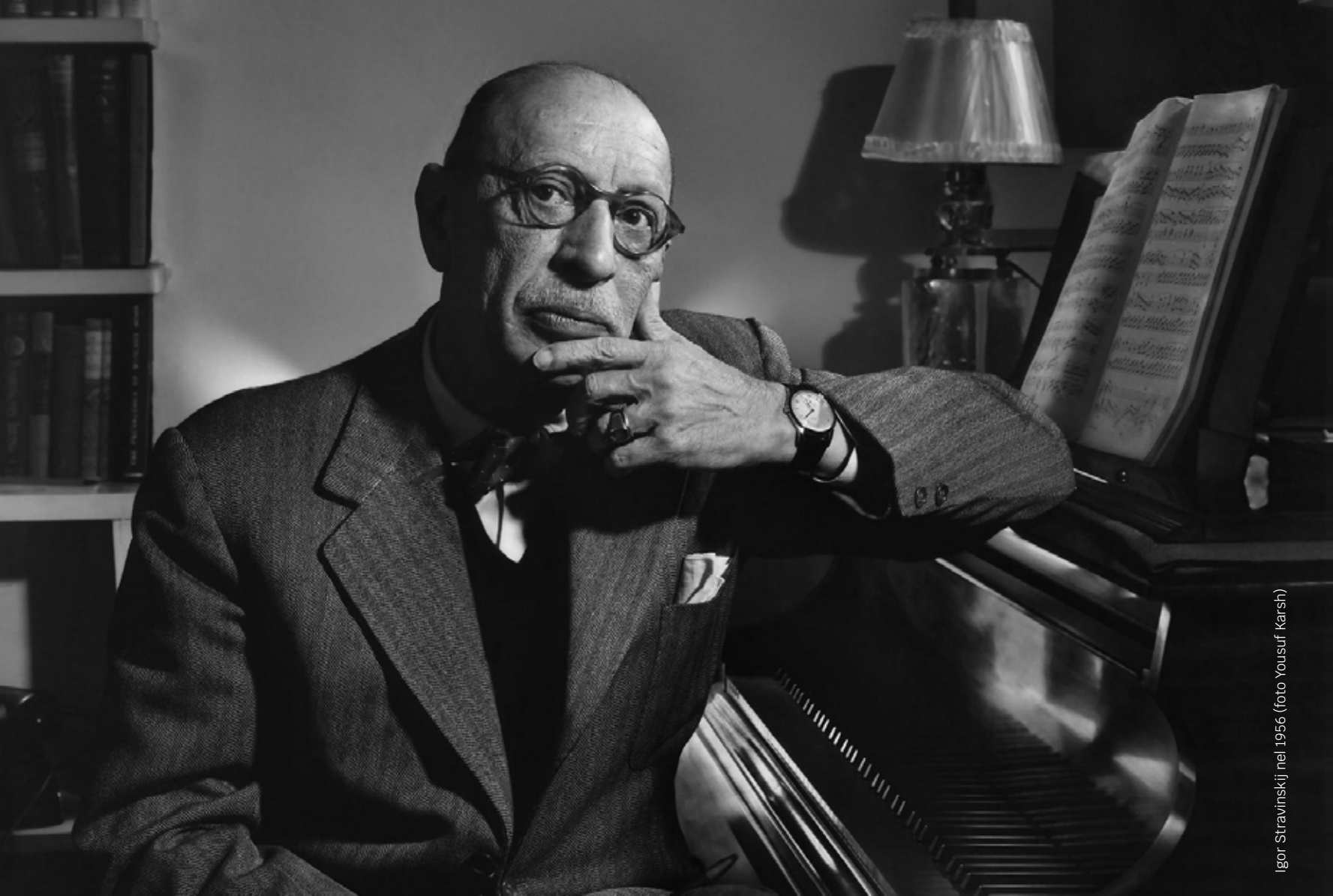
Igor Stravinskij nel 1956