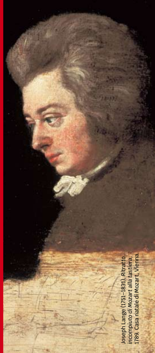
Joseph Lange (1751-1831), Ritratto incompiuto di Mozart alla tastiera , 1789. Casa natale di Mozart, Vienna.