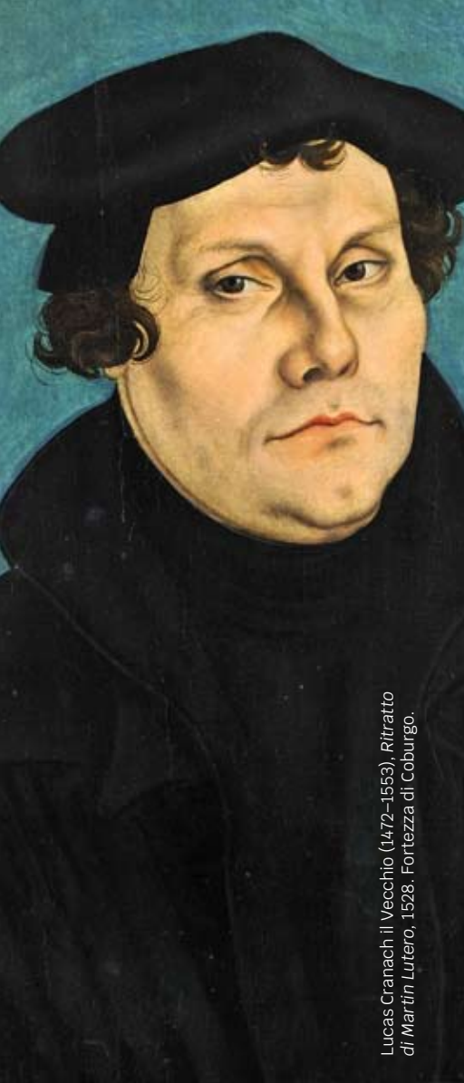
Lucas Cranach il Vecchio (1472–1553), Ritratto di Martin Lutero, 1528. Forzezza di Coburgo.

Al centro ideale del programma di questo concerto di Natale si staglia uno fra i più celebri corali composti da Martin Lutero : Vom Himmel hoch, da komm' ich her (Dall'alto dei Cieli io vengo quaggiù), scritto probabilmente per celebrare il Natale dell'anno 1534 . A distanza di circa un lustro fu lo stesso Lutero a dotare quei versi di una propria melodia, destinata a divenire nei secoli successivi uno dei canti liturgici più frequentemente utilizzati nel repertorio di musica sacra; tanto che è oggi difficile quantificare la moltitudine di elaborazioni e trascrizioni approntate da schiere di compositori in differenti epoche storiche.